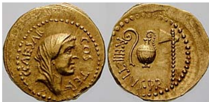
FOTO 4: Áureo de Julio Cesar acuñado en el 47 a.C. a su vuelta de Alejandría. La pieza es un claro ejemplo de propaganda política, al representarse los atributos de Máximo Pontífice y escoger la leyenda CAESAR DICT

Cesar empezó a acuñar moneda una vez roto el Triunvirato, cuando cruzó del Rubicón en el 49 a.C., se hizo con la maquinaria de gobierno romano y se apropió del tesoro estatal. Los áureos que acuñó representan la primera emisión en varias décadas, pues los últimos que se hicieron, fueron en homenaje al triunfo de Pompeyo en el 71 a.C. La moneda de Cesar es fácil de datar, porque en ella siempre se hace referencia a alguno de los cargos que ostentaba.