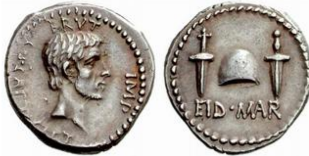
FOTO3: Denario de Bruto en conmemoración del asesinato del dictador, Julio Cesar en los Idus de Marzo tal y como proclama la leyenda del reverso, los dos puñales y gorro de liberta.

Tanto Plutarco como Suetonio hablan, de las numerosas advertencias que llegaron a casa del dictador, antes de la conjura. Anecdótico podría resultar, sin los acontecimientos del día siguiente, cuando la noche antes de su asesinato, Julio Cesar dijo preferir una muerte inesperada y rápida ( subitam et celerem ). Los malos augurios en los que el dictador romano ya había demostrado no creer, le hicieron dudar en esta ocasión, pues sin la participación de Décimo Bruto en la conspiración, que le animó a ignorarlos y acudir al Senado, el éxito de la misma hubiese resultado imposible.