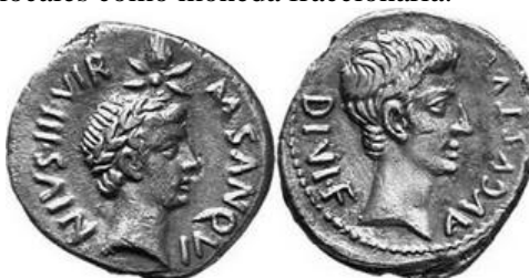
FOTO 5: Denario acuñado en época de Augusto (17 a.C.), con el retrato de Julio Cesar y la representación sobre él de un cometa cuya estela debió ser visible poco después del 44 a.C. La aparición del cometa se atribuyó a la muerte del gran dictador, deificado en el 42 a.C.

El sistema monetario que encontramos, es por tanto un sistema que se ajustaba perfectamente a las necesidades del esquema imperialista romano, con una moneda universal y la aceptación de emisiones locales como moneda fraccionaria.