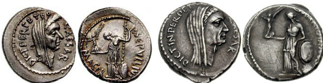
FOTO 1: Izquierda: anverso de un denario de P. Sestius Tertius. Acuñado entre Enero y Febrero del 44 a.C. Derecha: Anverso de denario de C. Cossutius Maridianus acuñado en Roma en e a.C. después del asesinato del dictador.1

Cayo Julio Cesar nació el 12 o el 13 de Julio del año 100 a.C. en una familia patricia de fuerte raigambre dentro de la fría aristocracia romana, la gens Iulia , que remontaba sus orígenes a Iulo hijo de Eneas y nieto de la diosa Venus. Dado lo privilegiado de su posición, gozó del legítimo derecho a hacer carrera senatorial, la cual mantuvo una progresión tan ascendente que desde sus inicios provocó recelos. Sin embargo, las circunstancias se aliaron con su persona, pues el hecho de que Pompeyo Magno y Marco Craso se enemistasen facilitó su actuación mediadora con la que se ganó el afecto de ambos y la aceptación de la oposición senatorial. Para ello tuvo que apoyarse también, en sus lazos familiares, muy influyentes desde que en el año 84 a.C. se casó con Cornelia, hija de Lucio Cornelio Cinna, socio de Mario en las Guerras Civiles. A partir de entonces, le ligaron al partido populista, de clara oposición al régimen de Sila, lo que le obligó incluso a exiliarse de Roma desde el 82 al 78 a.C. Su apoyo siempre al pueblo frente a los seguidores de Sila, partidarios del sector más aristocrático, le hizo ganarse el favor de las masas de las que supo sacar siempre el máximo partido.